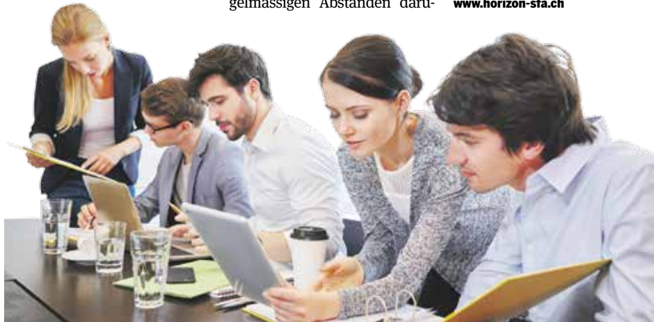
Wissensinhalte dann am PC abrufen, wenn diese gebraucht werden: Das ist «Learning on demand».

ber Rechenschaft ablegen, dass wir in gewissen Themenbereichen – beispielsweise in der Anlageberatung – auf dem neuesten Stand sind.» Learning on demand bedeute für ihn, bezüglich Dauer, Ort sowie Zeitpunkt so flexibel wie möglich zu sein. *Namen der Redaktion bekannt GABRIEL AESCHBACHER www.learningondemand.20min.ch www.horizon-sfa.ch