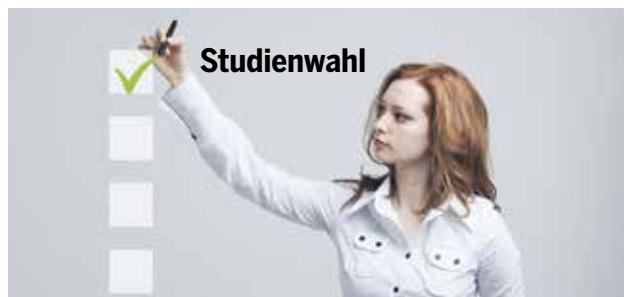
Der Studienwahlcheck als erste Entscheidungshilfe.