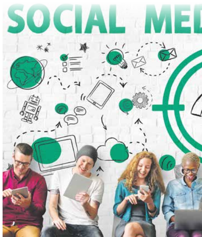
Immer mehr Firmen streuen ihre Kommunikation zunehmend auf diversen Soc