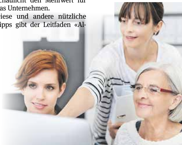
Altersgemischte Teams bereichern den Arbeitsalltag.